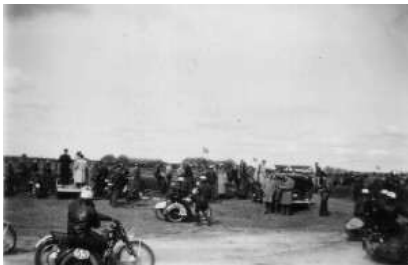
Sidevognskørerne ankommer til banen