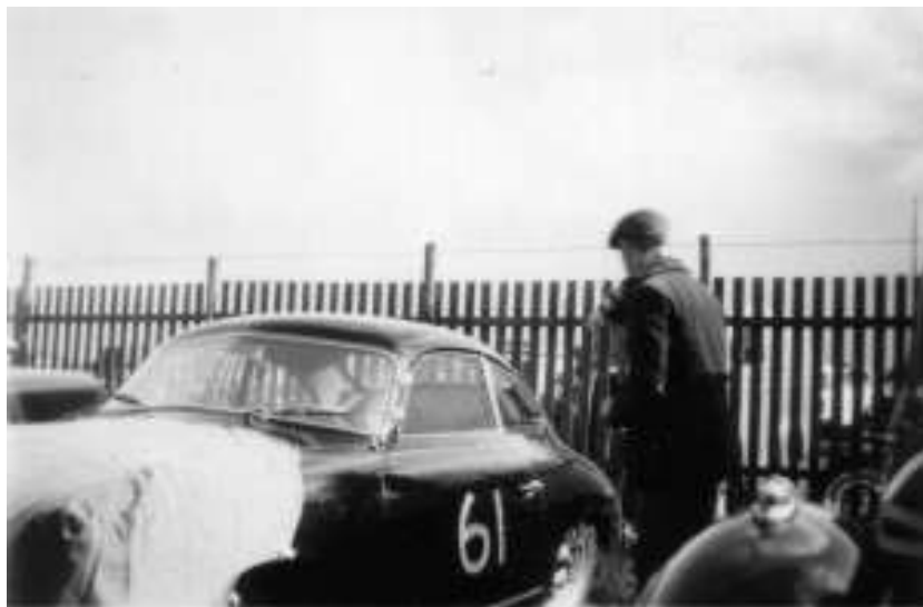
En Porsche kunne også findes på banen i Hobro