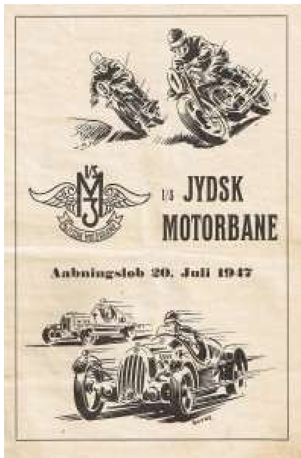
Programforsiden fra Åbningsløbet