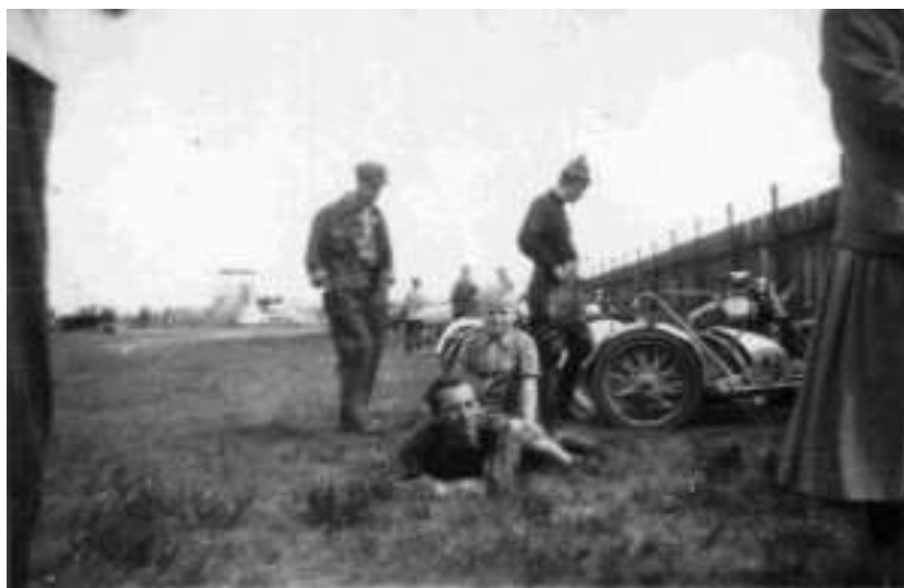
En hyggepause i ryttergården