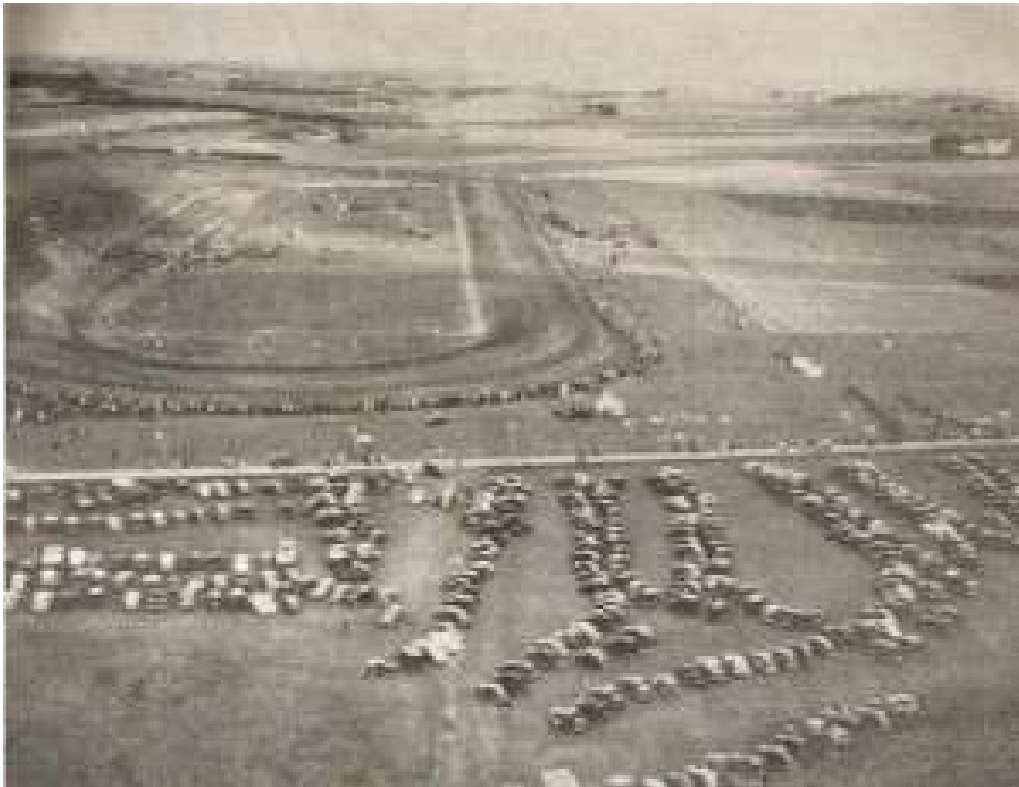
Et gammelt luftfoto af Jydsk Motorbane (Desværre er billedkvaliteten ret ringe.)

Arealkøbet blev godkendt og opførelsen af en 1000 meter lang jordbane for automobiler og motorcykler blev besluttet. Banen skulle stå færdig samme år. Jydsk motorbane I/S blev således åbnet kun 3 måneder senere den 20/7 1947.