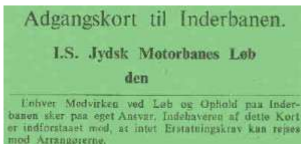
Alle banens officials skulle have sådan et kort på sig